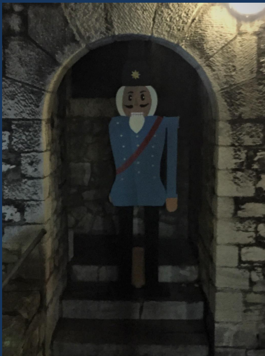
Nussknacker hält Wache auf dem Weihnachtsmarkt der Stolberger Burg